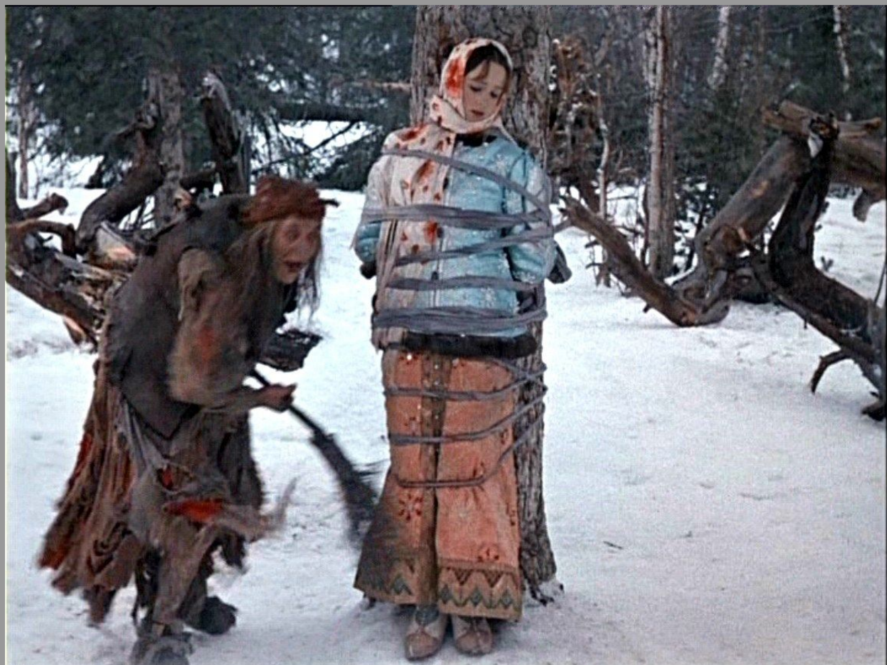
Baba Yaga in Morozko 1964

While many prey on children, some steal brides, and terrorize adults just as much.