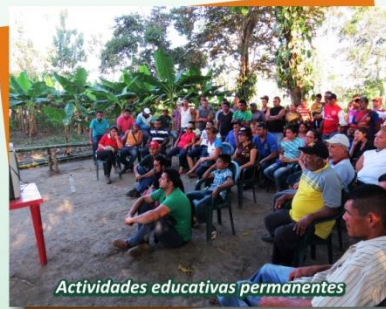
Actividades educativas permanentes

Nuestra razón de ser es un proceso colectivo de transformación personal.