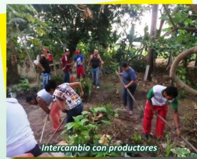
Intercambio con productores