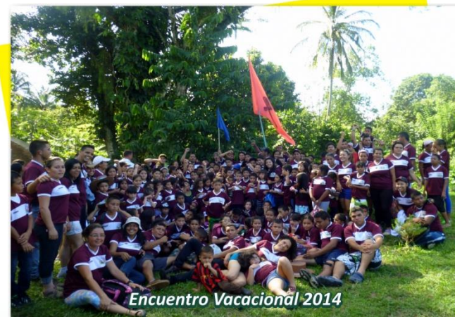
Encuentro Vacacional 2014