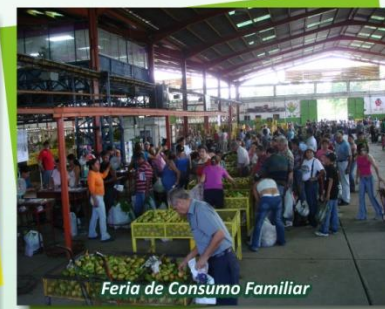
Feria de Consumo Familiar