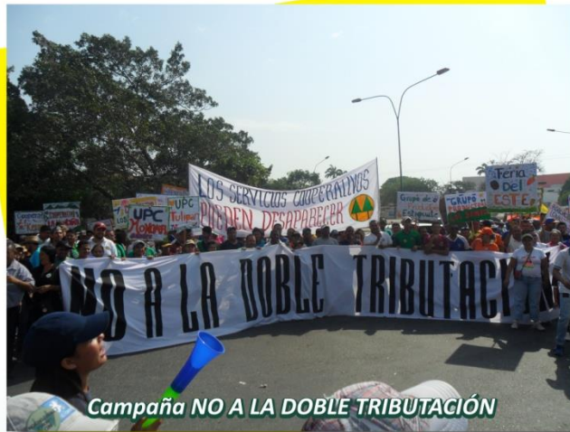
Campaña NO A LA DOBLE TRIBUTACIÓN