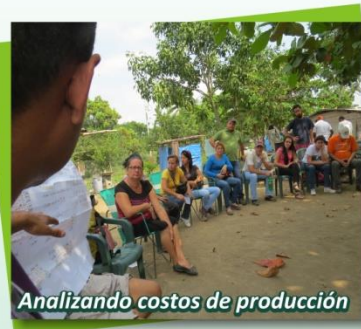
Analizando costos de producción