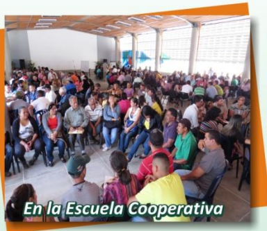
En la Escuela Cooperativa