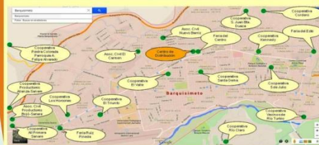
* 20 puntos de abastecimiento.