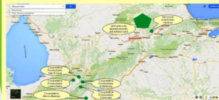
En total somos 26 organizaciones comunitarias de abastecimiento de alimentos.